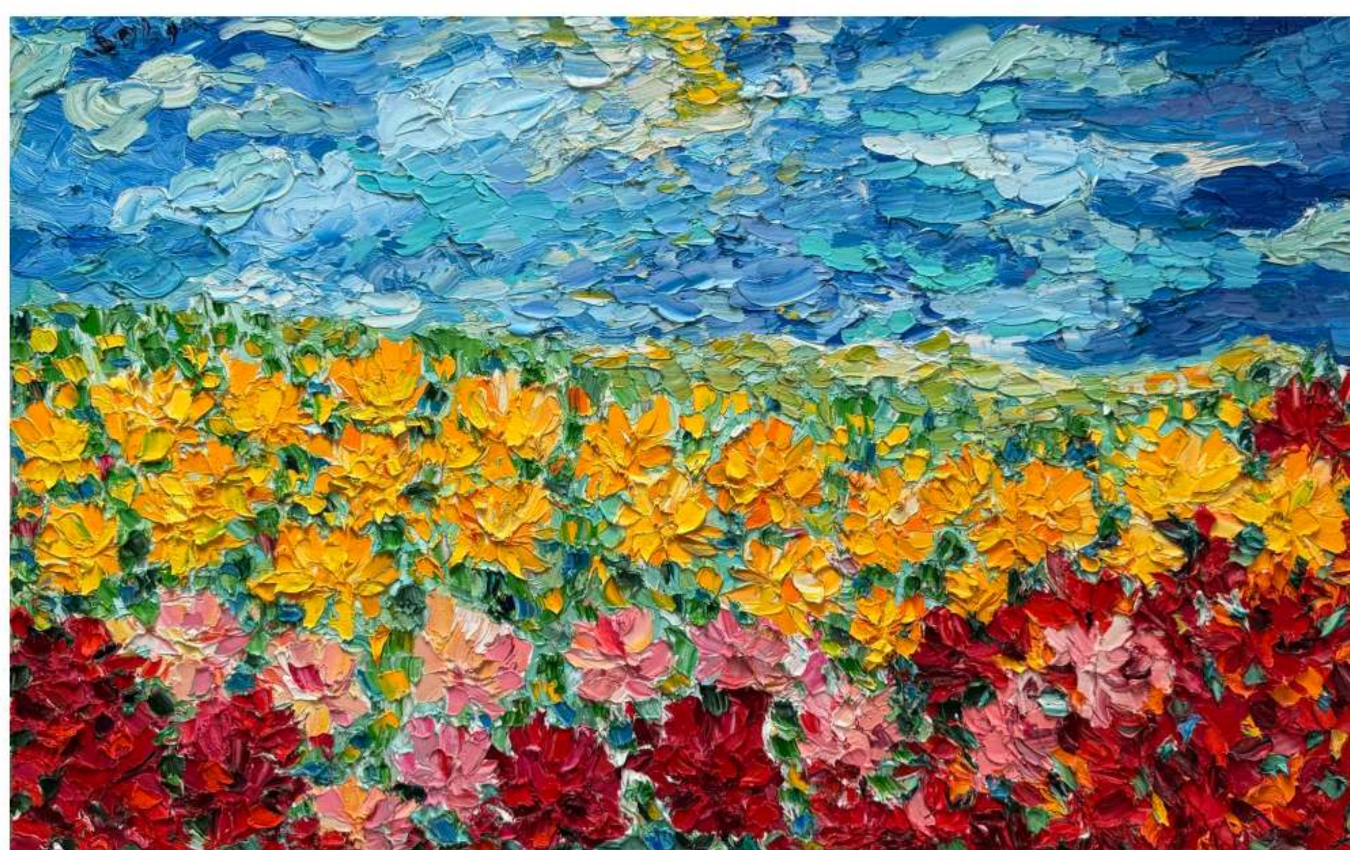
«Поляна Курандеро» 120 x 70 см, 2025