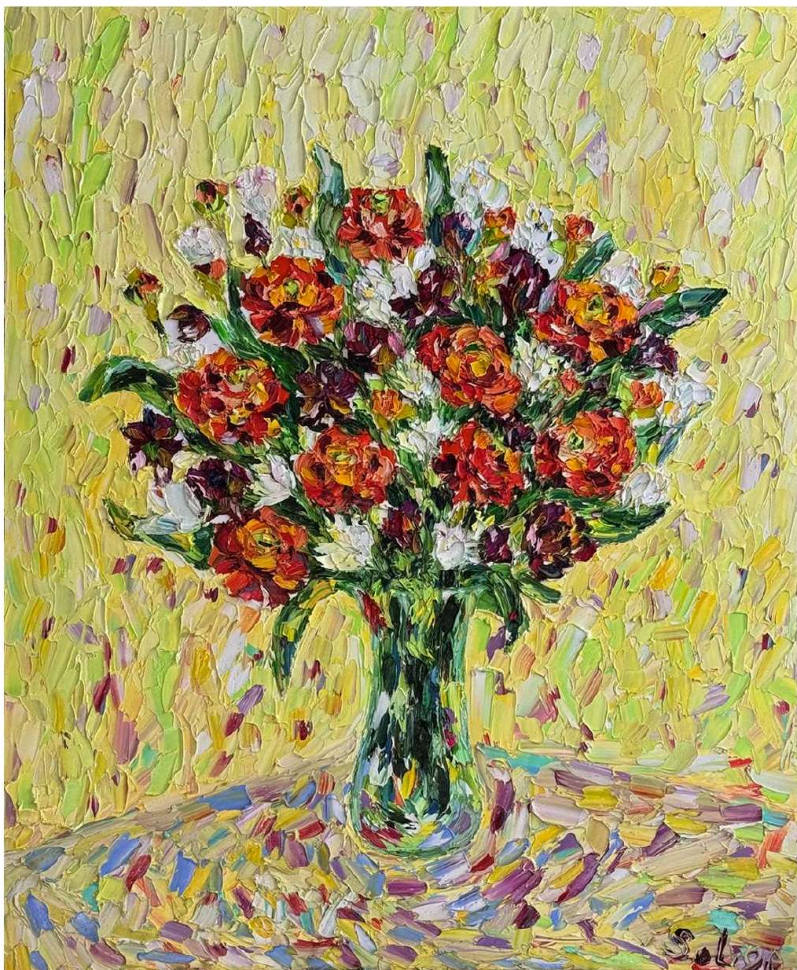
«Утренний букет» 80 x 100 см, 2026