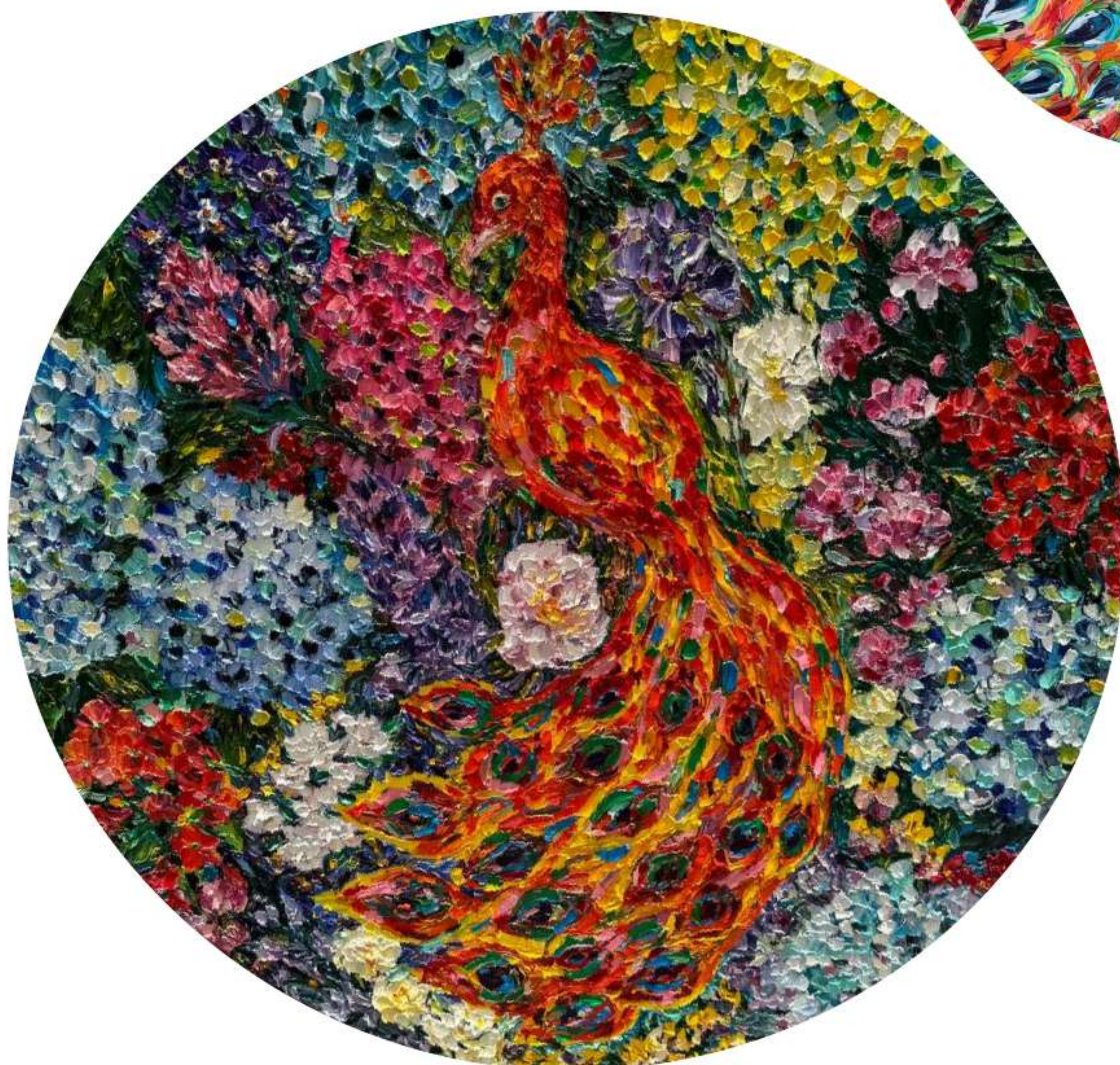
«Жар-Птица» 160 x 160 см, 2024