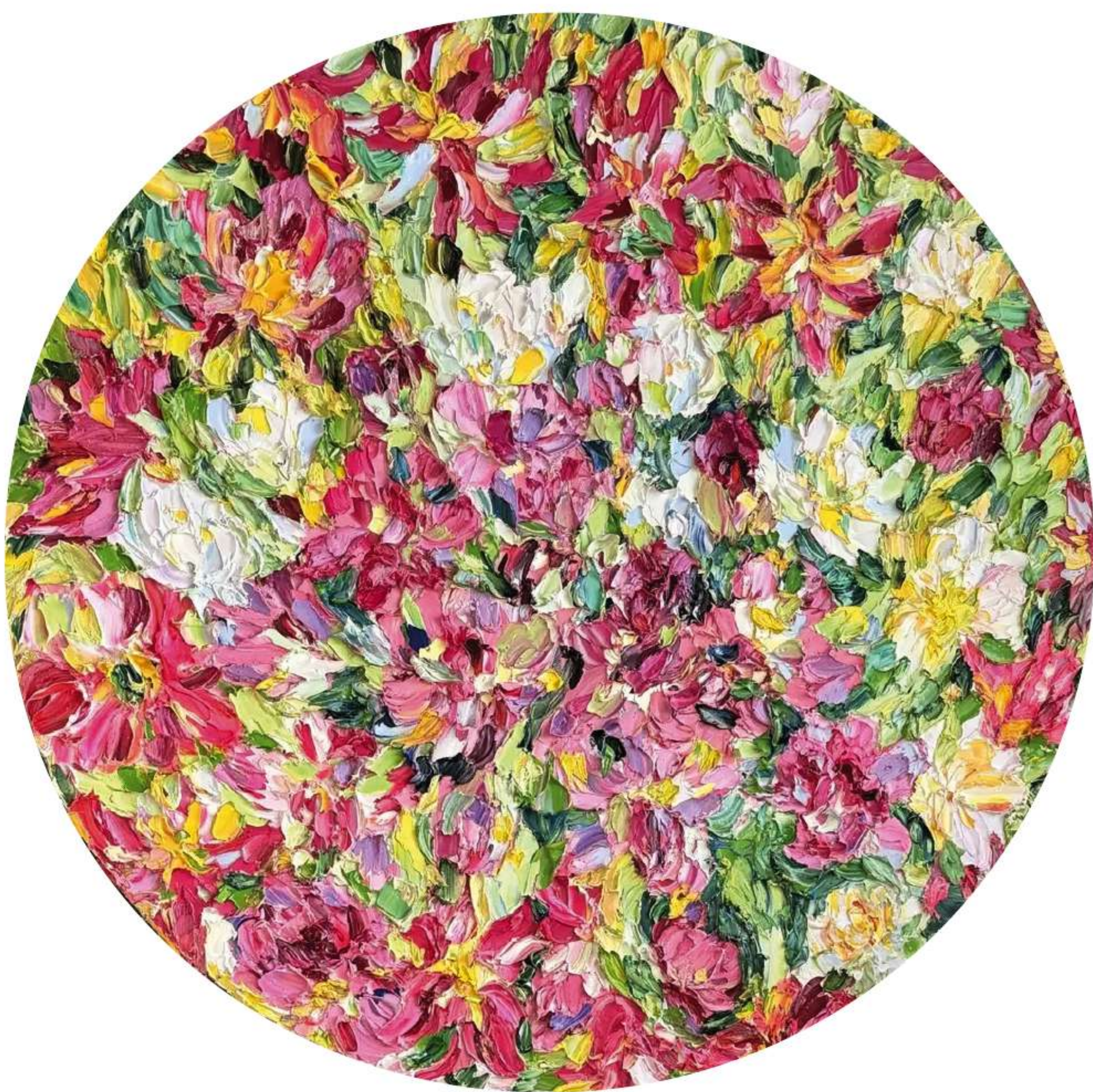
«Ожидание Весны» 90 x 90 см, 2026