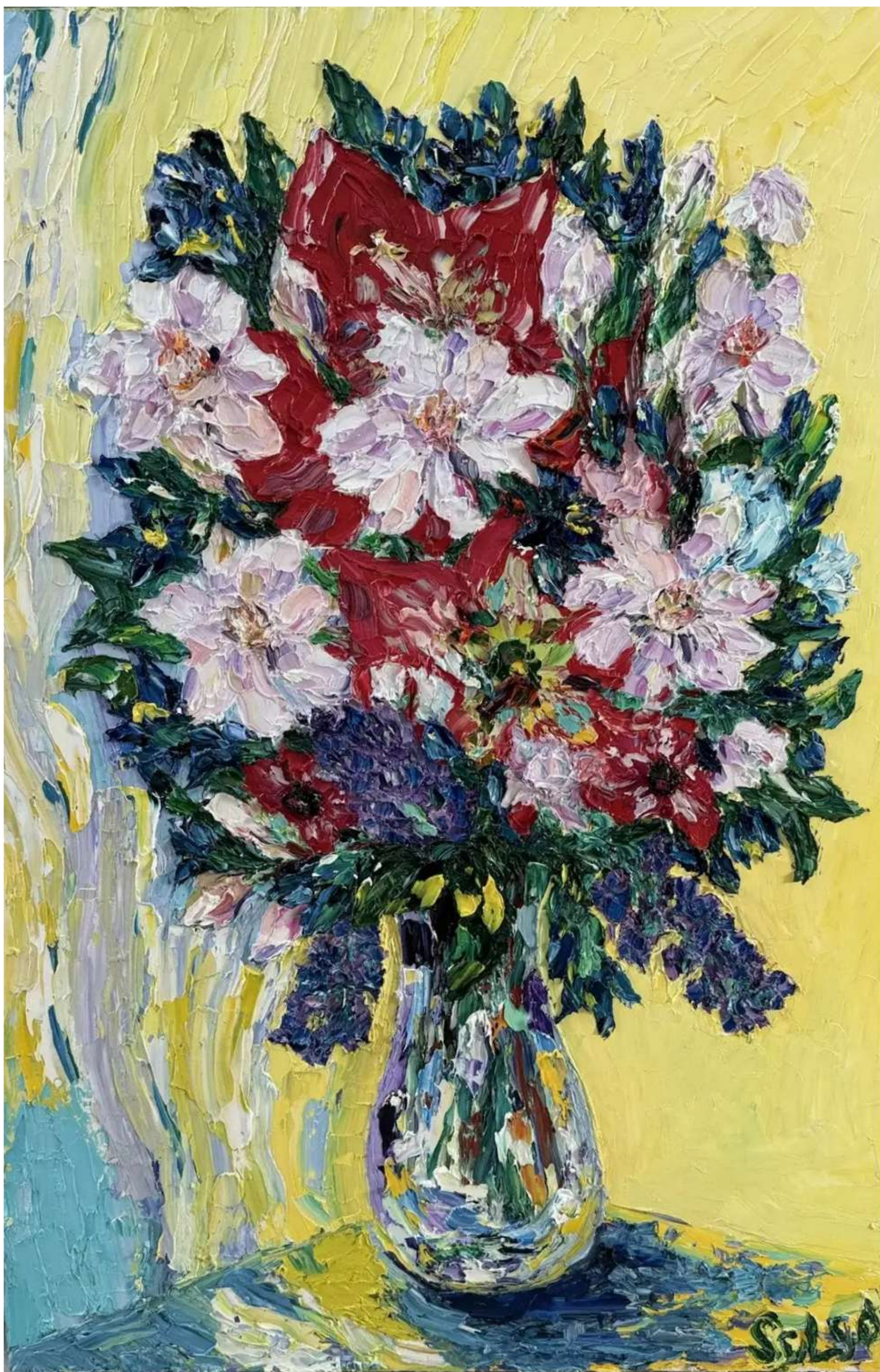
«Несущая перемены» 60 x 90 см, 2023