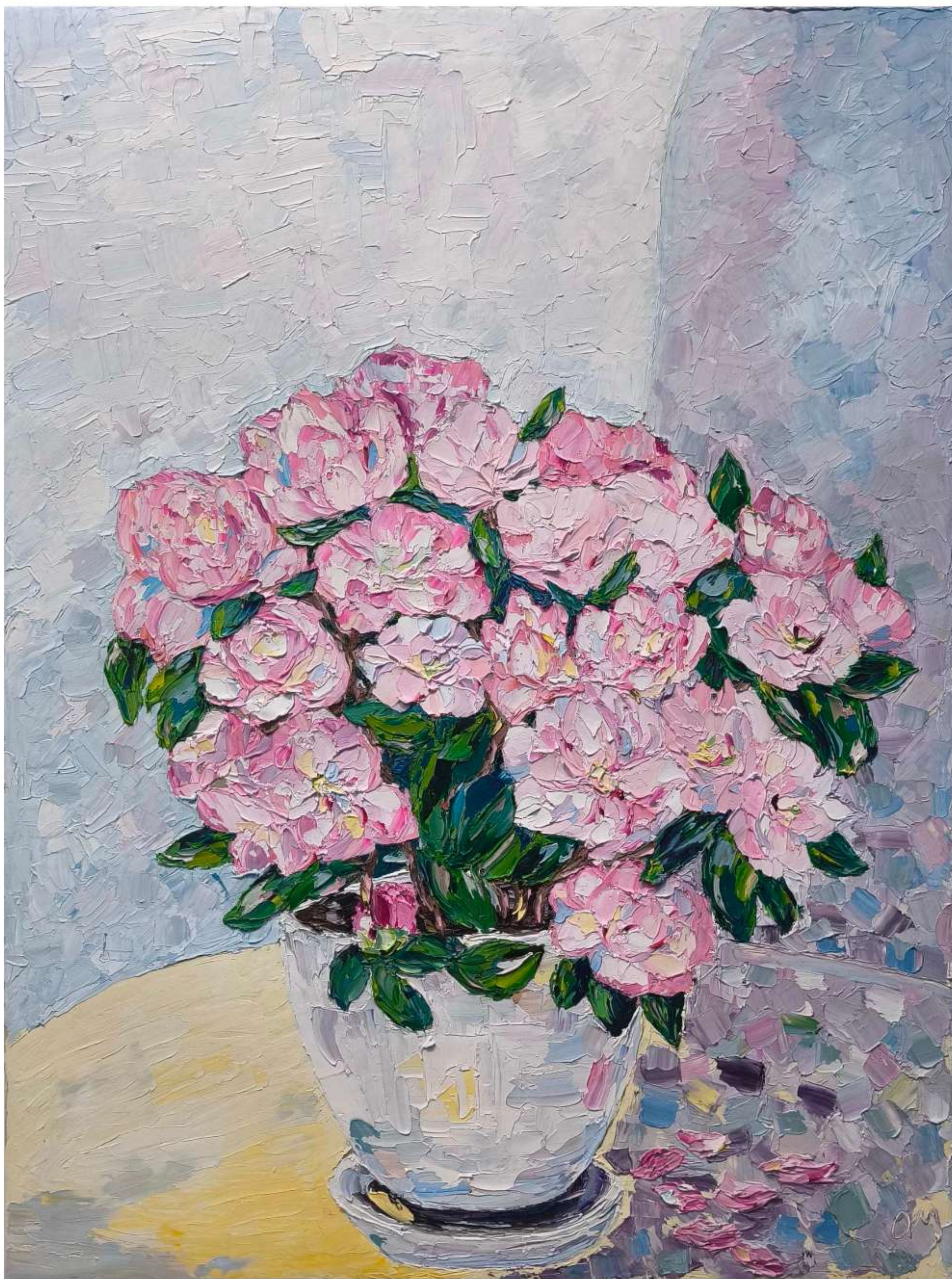
«Азалия» 80 x 100 см, 2024