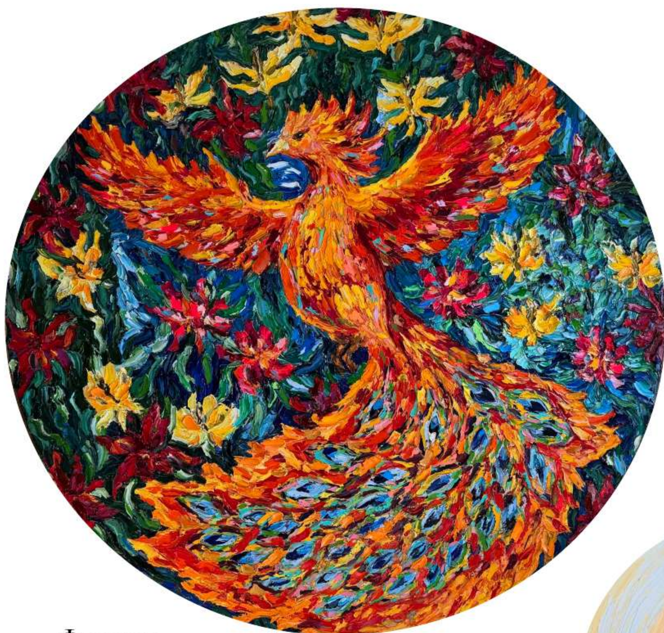
«Феникс в садах Курандеро» 160 x 160 см, 2026