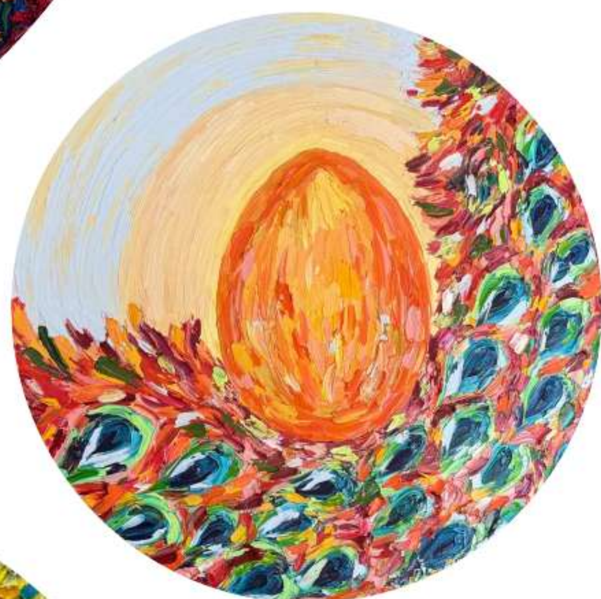
«Новая жизнь» 80 x 80 см, 2026