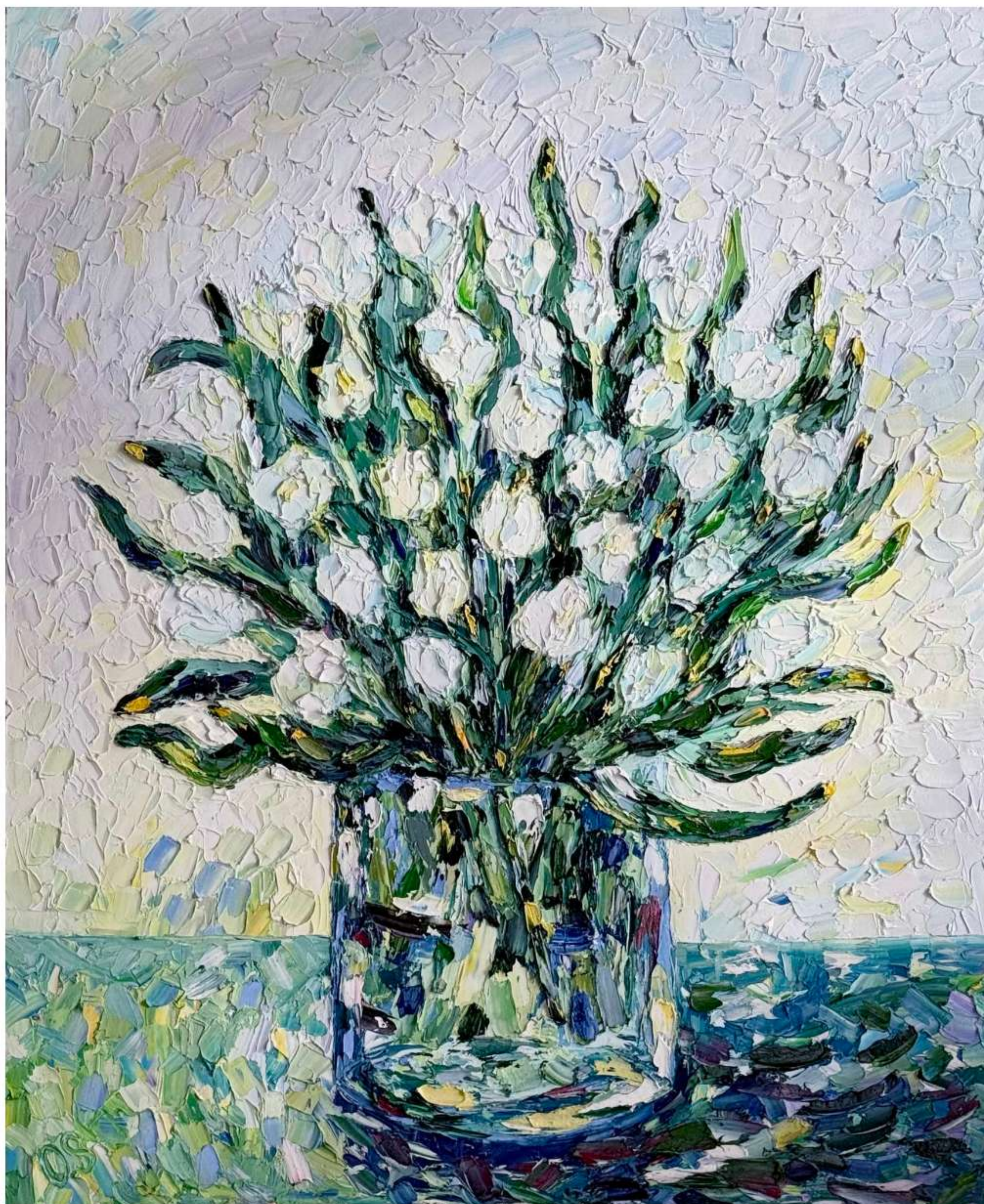
«Тюльпаны» 80 x 100 см, 2023