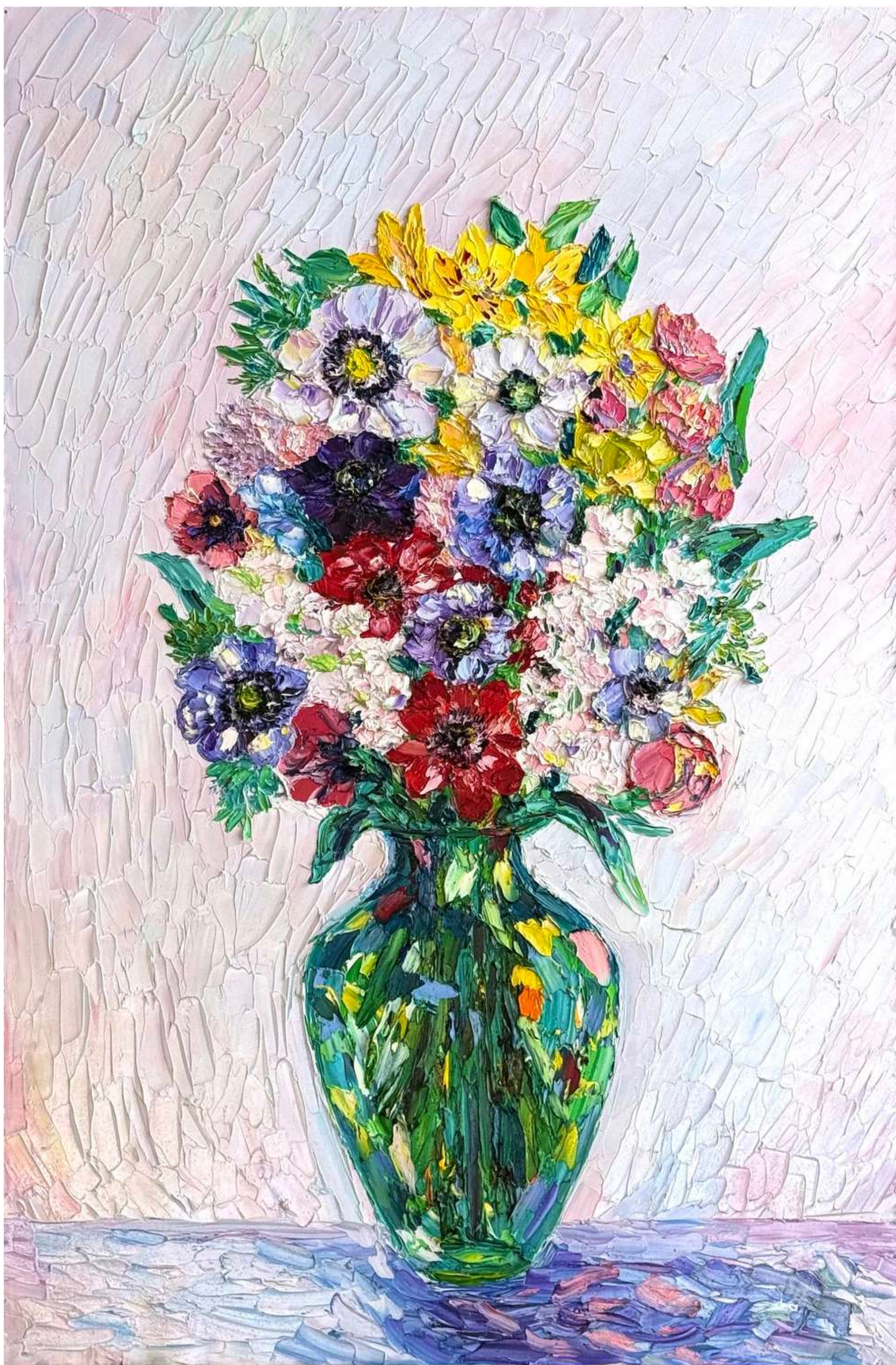
«Анемоны в зеленой вазе» 60 x 90 см, 2025