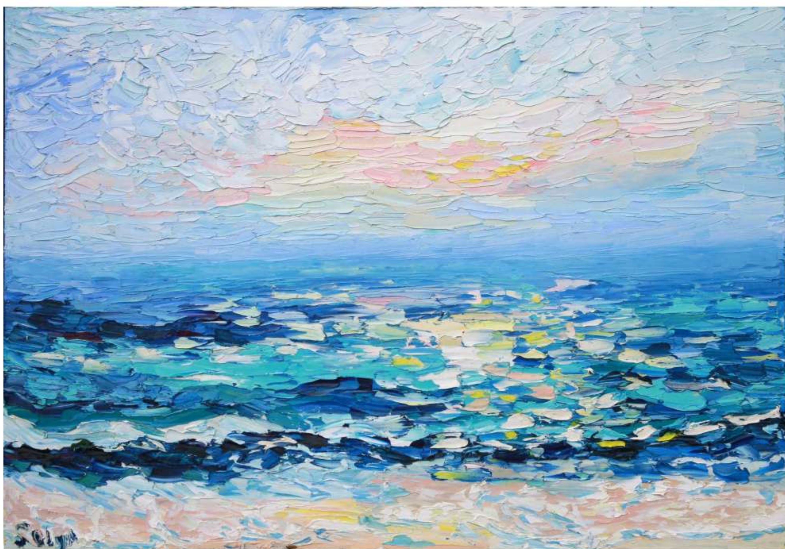
«Рассвет над океаном» 120 x 70 см, 2025