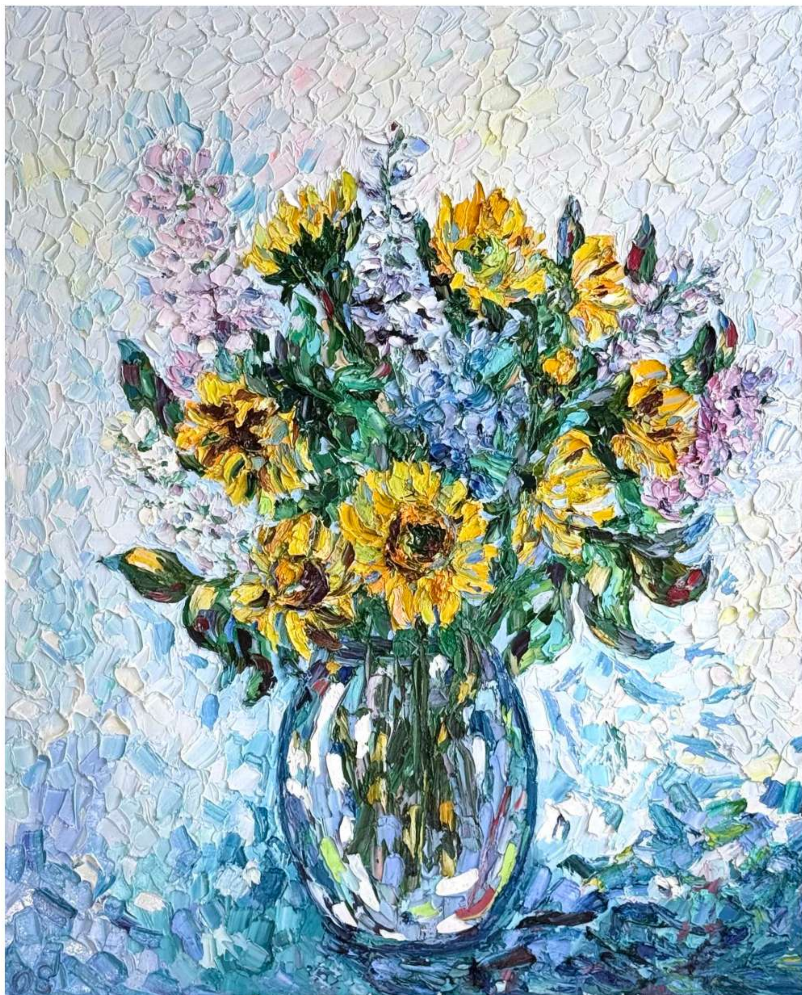
«Вдохновение» 80 x 100 см, 2023