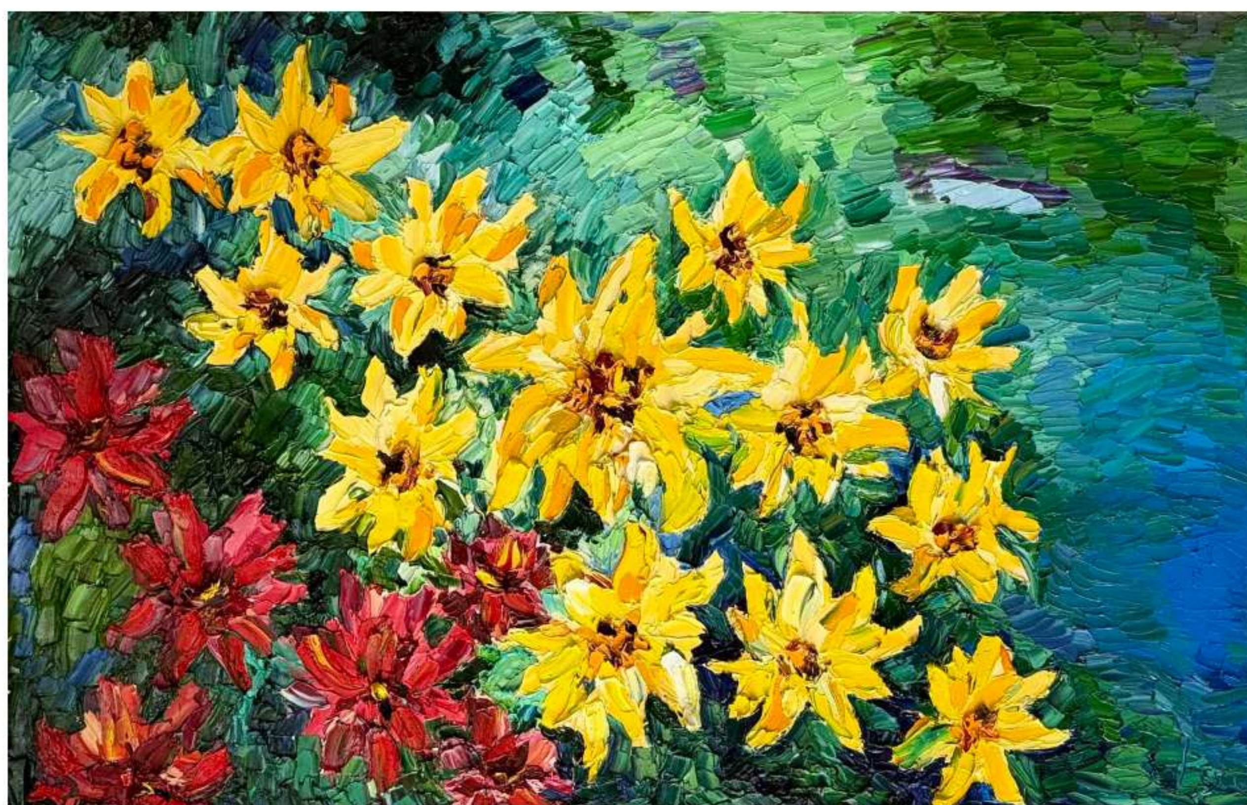
«Сны Курандеро» 120 x 70 см, 2025