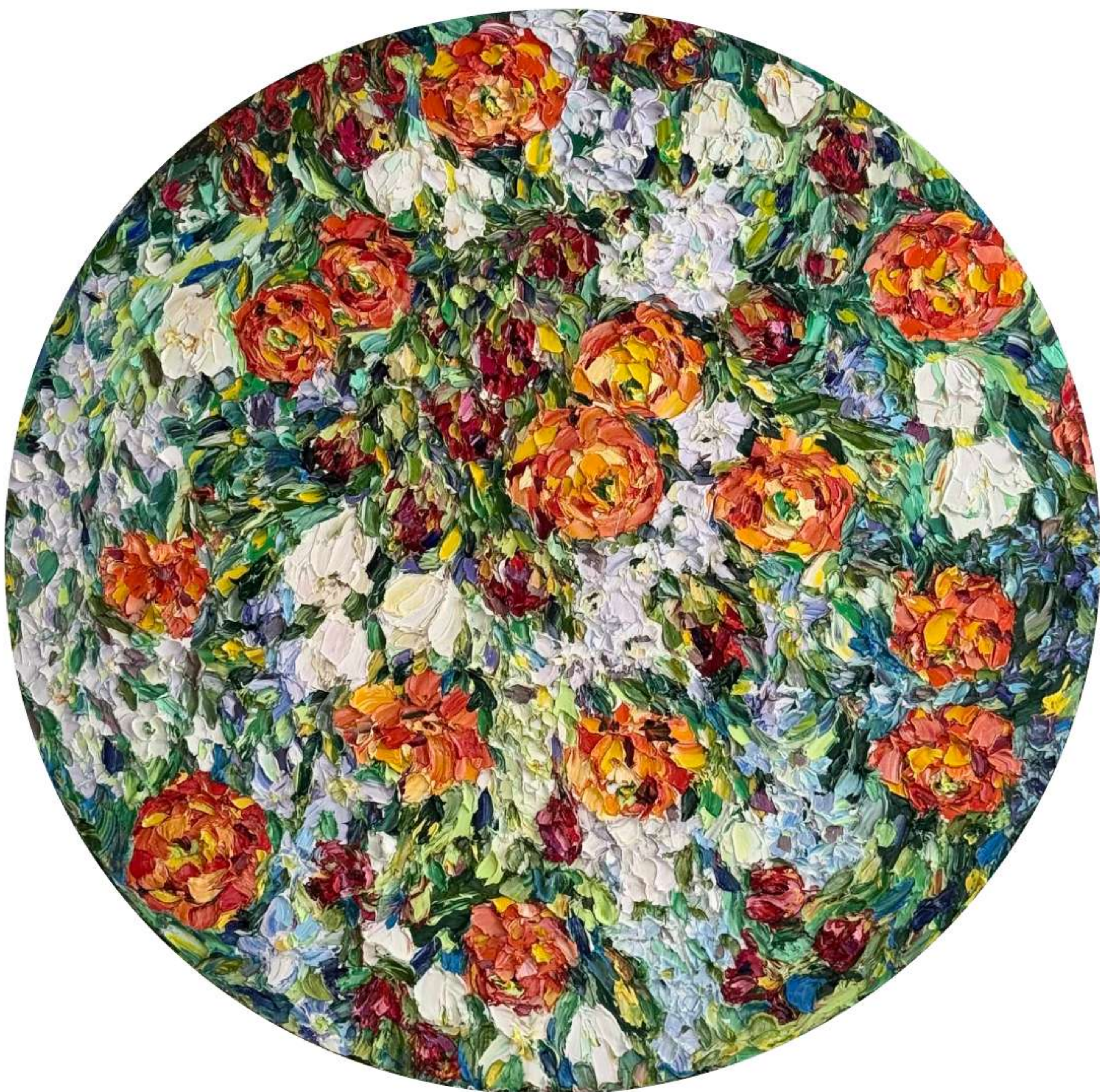
«Жажада Жизни» 80 x 80 см, 2026